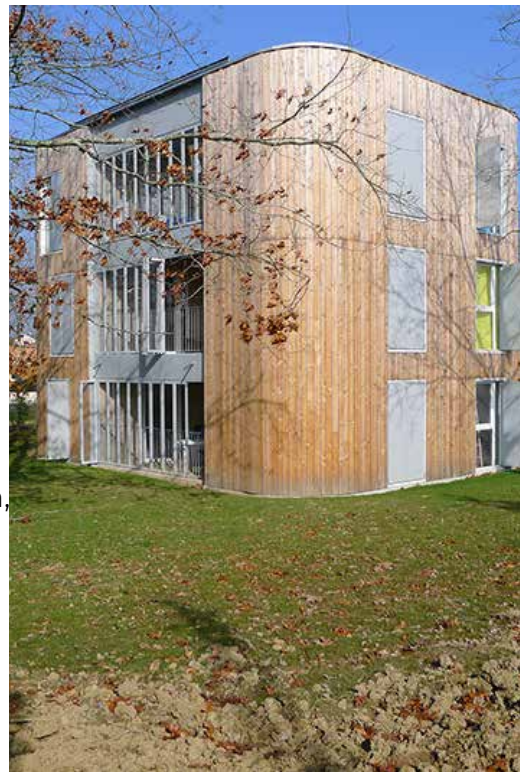
MO Habitat 44 - Archi. AUD Vincent Perraud - Vallet (44)

La gestion des eaux est à prendre en compte avec une réflexion sur la réutilisation des eaux de pluie pour l’arrosage des espaces verts ou pour un usage sanitaire.