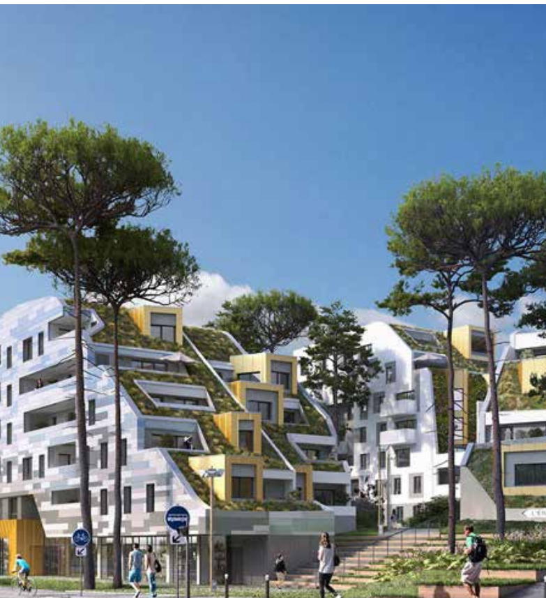
MO Ataraxia - Archi. PADW - Nantes (44)