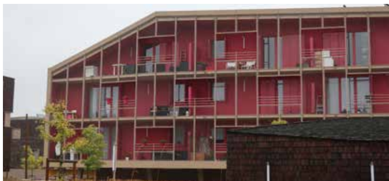
MO Val d'Oise Habitat - Archi. Vagabond architectes Menucourt (95)

La gestion des déchets de chantier doit être définie et communiquée avant la mise en chantier... Les arbres et la biodiversité en général seront protégés pendant les travaux.