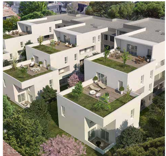
MO Marignan Immobilier - Archi. Tangram Architectes - Marseille (13)