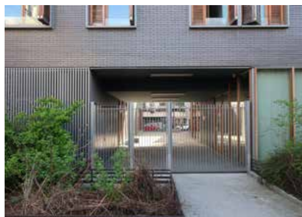
MO RIVP - Archi. MG-AU Michel Guthmann Architecture & Urbanisme - Paris (75)

Les parkings en sous-sol laisseront les espaces en surface libres et sûrs pour les piétons et vélos.