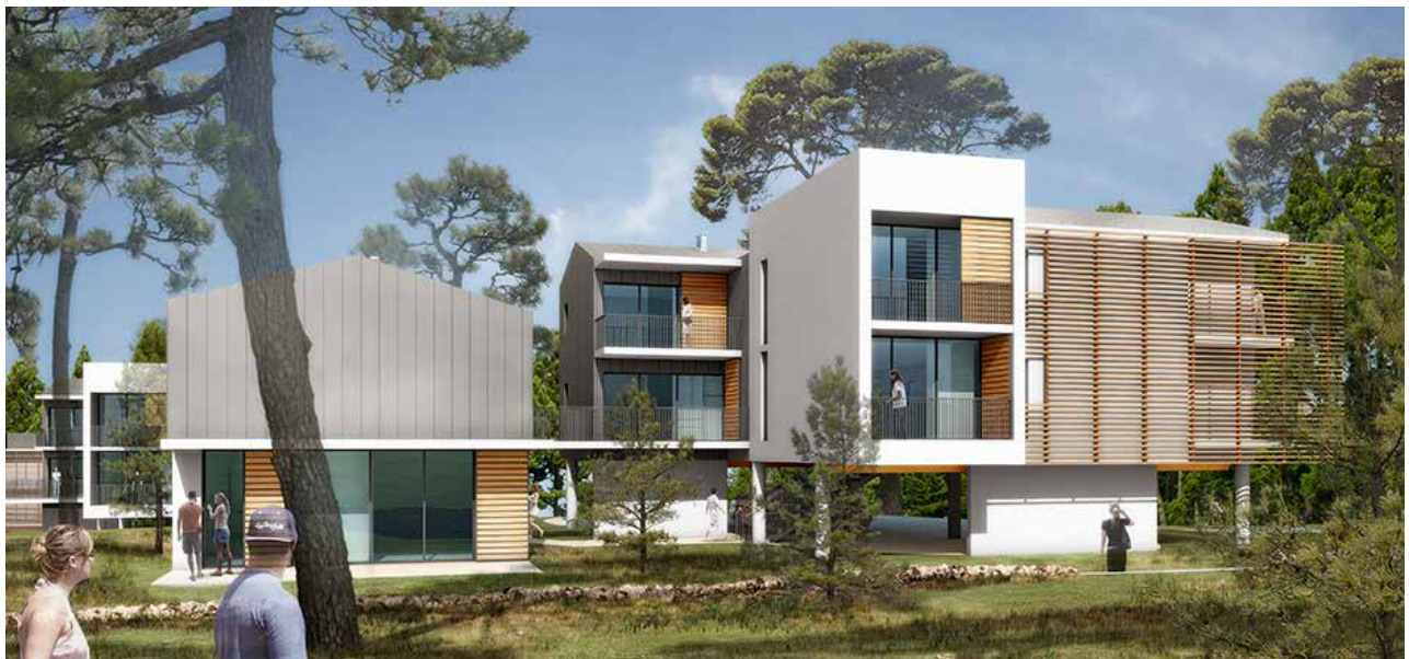
MO Vaucluse Logement - Archi. Atelier Johan Maigre - Martigues (13)