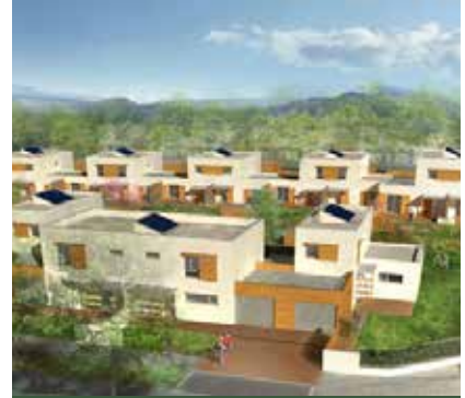
MO Sacoviv - Archi. Pierre Genoud Eurl d'Architecture - Venissieux (69)

Ces différents points montrent l'importance de la consultation d'un paysagiste-concepteur dans les projets en partenariat avec l'aménageur et l'architecte.