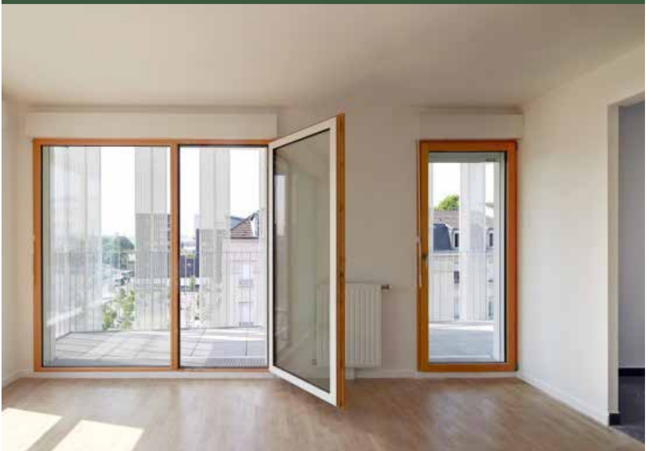
MO Batilaine - Archi. Gerin-Jean Fabienne - Saint Denis (93)