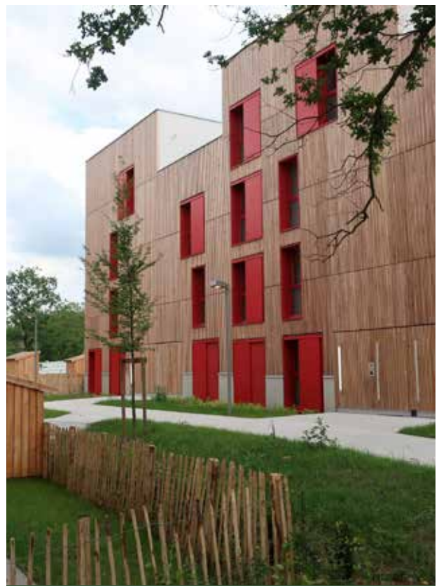
MO Immobilière 3F - Archi. Atelier Pascal Gontier - Bessancourt (95)