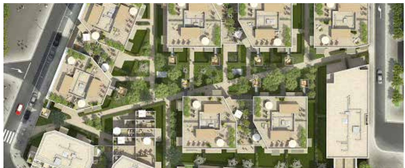
MO Bouygues Immobilier - Archi. Brenac & Gonzalez & Associés - Romainville (93)