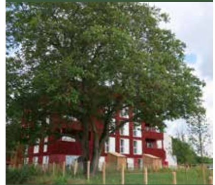
MO Immobilière 3F - Archi. Atelier Pascal Contier Bessancourt (95)