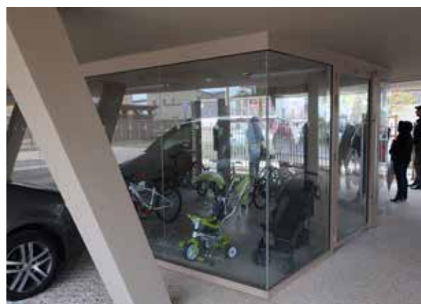
MO Val d'Oise Habitat - Archi. Vagabond architectes - Menucourt (95)