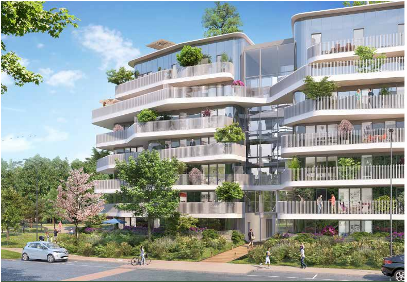
MO Care Promotion et H2 Promotion - Archi. Fragments Architecture- Velizy-Villacoublay (78)