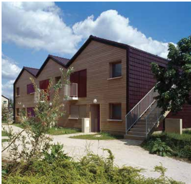
MO Pierres & Lumières et Commune de Villiers-le-Bâcle - Archi. Atelier PO&PO - Villiers-le-Bâcle (91)