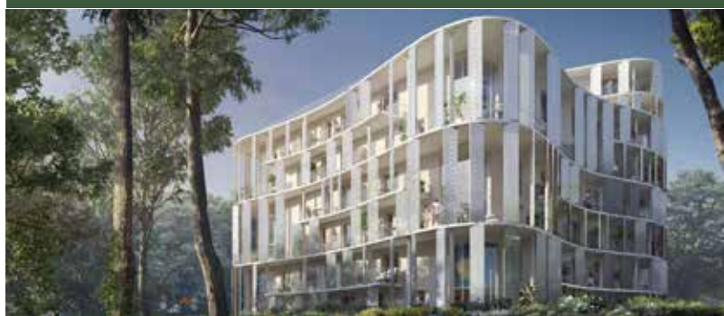
MO Nexity - Archi. Oxo Architectes - Marseille (13)