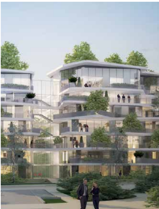
MO Care Promotion et H2 Promotion - Archi. Fragments Architectures - Velizy-Villacoublay (78)