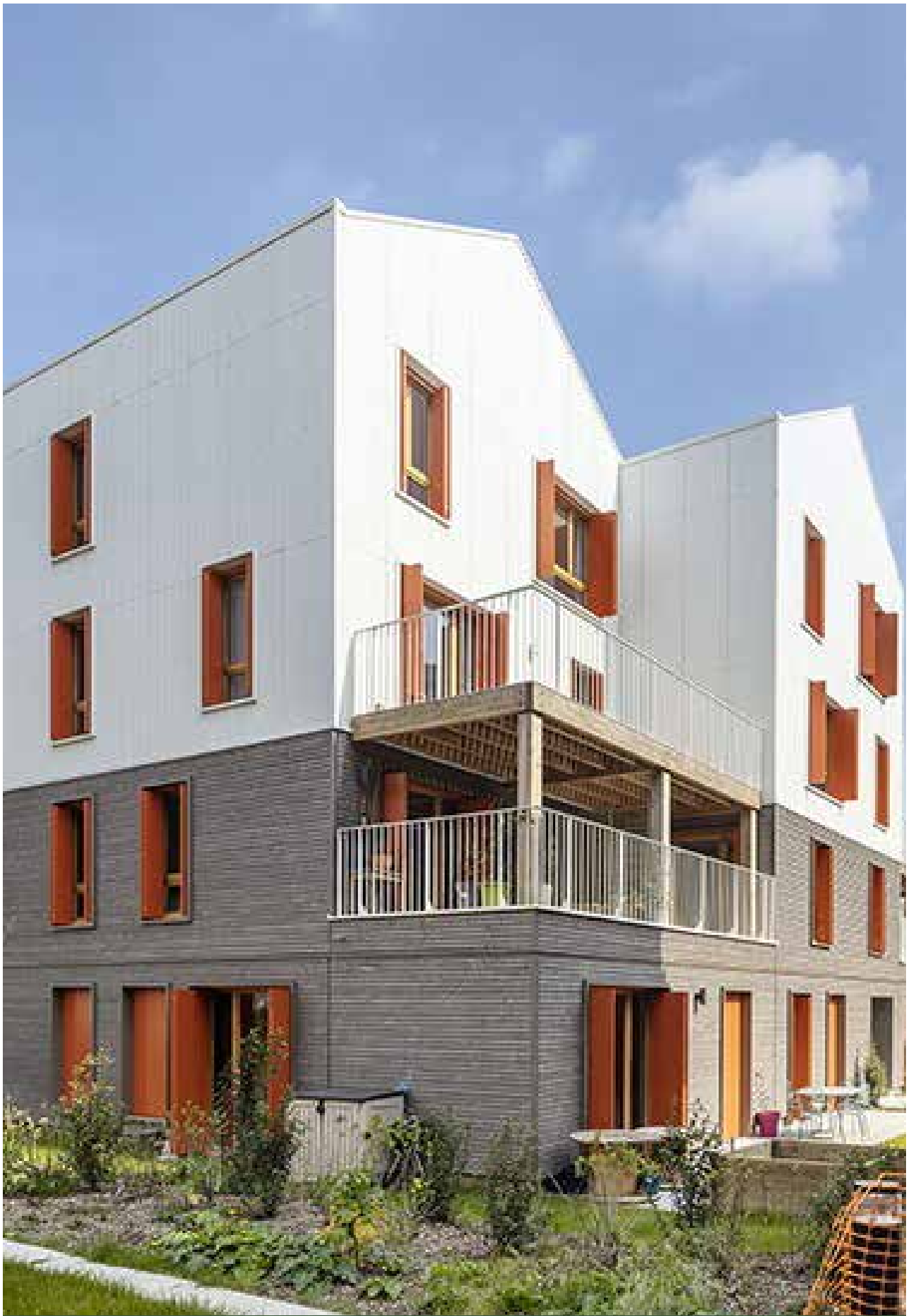
MO Atland Quartus - Archi. CoBe - Ile-Saint-Denis (93)